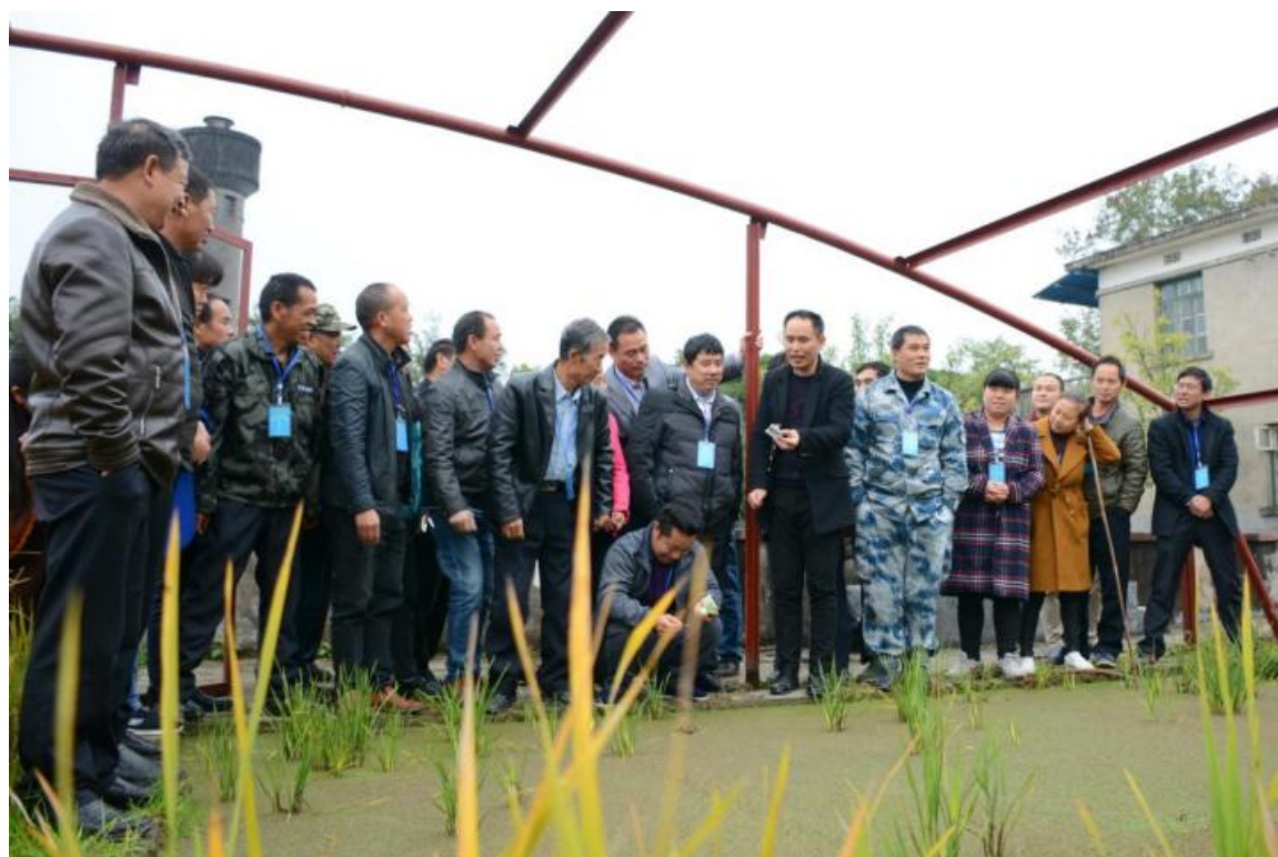
种子生产技术实训