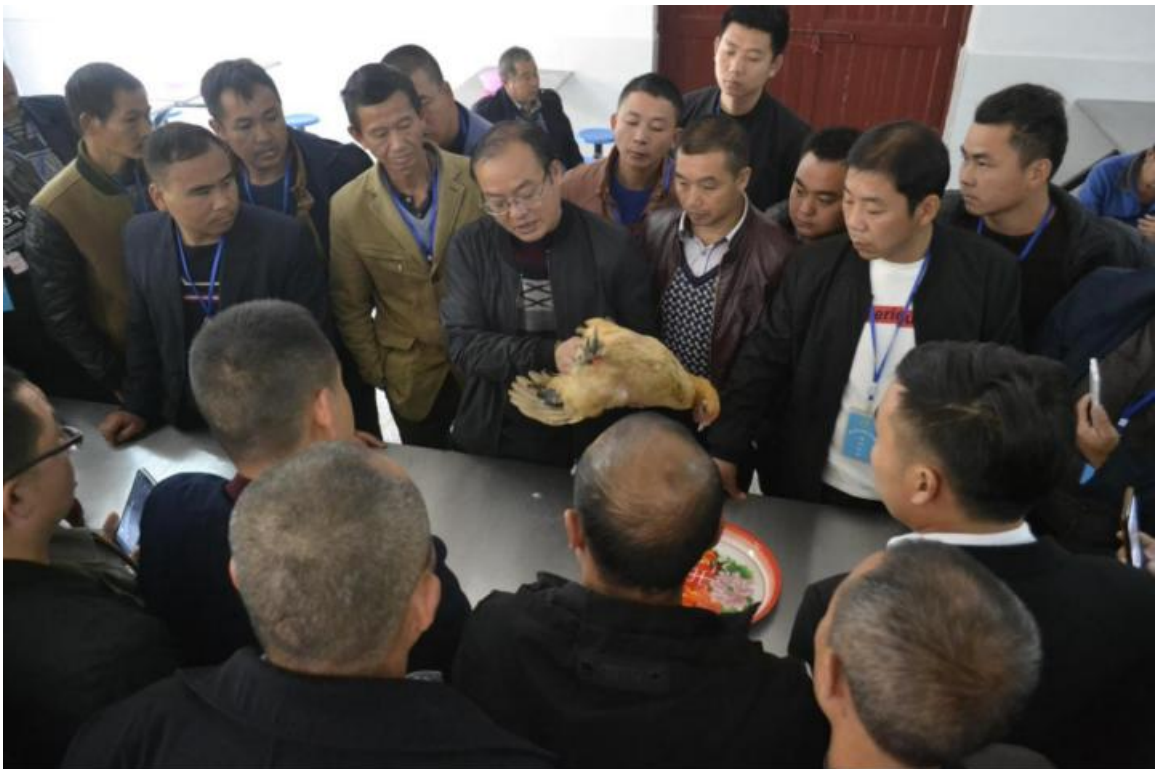
家禽常见病诊治技术实训