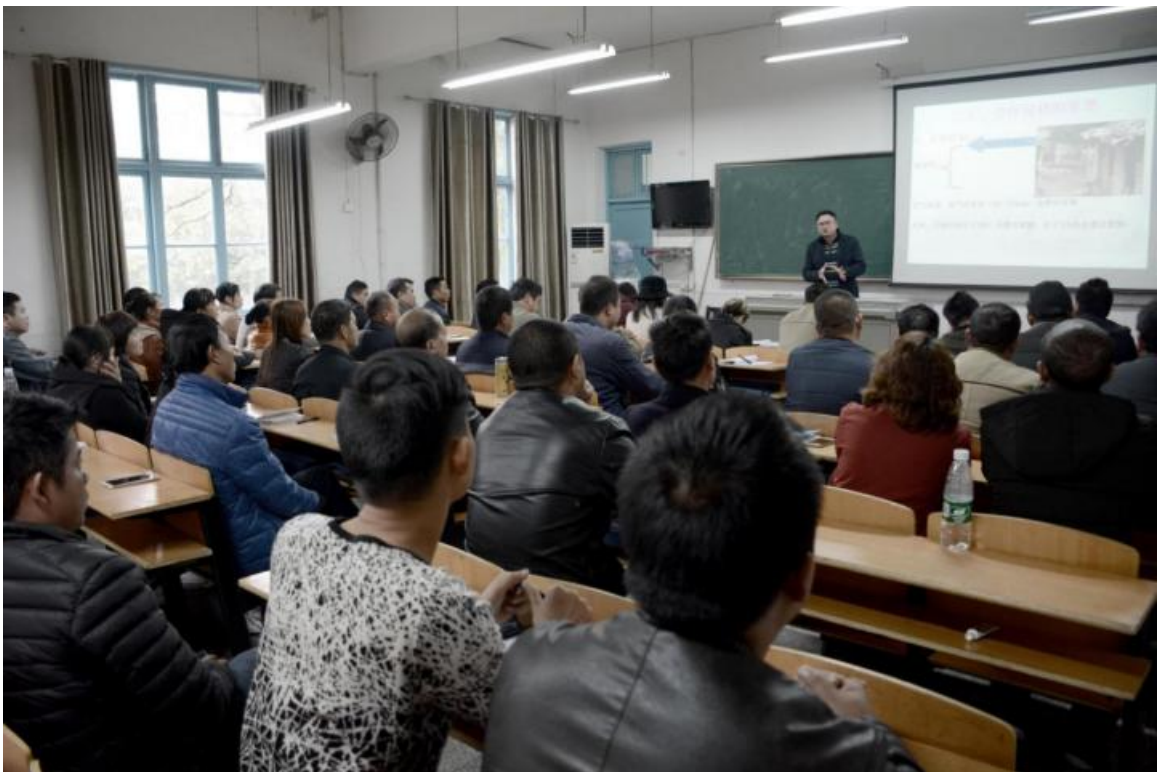
动物传染病防治技术课堂教学