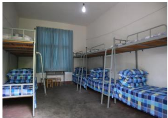
标准学员宿舍外观及内部情况