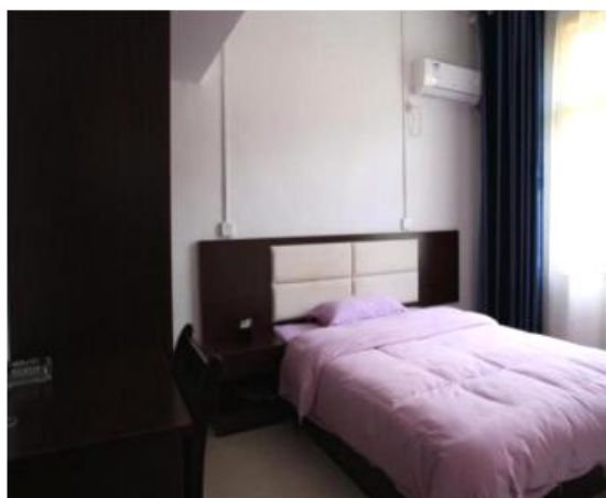
酒店标间式学员宿舍外观及内部情况