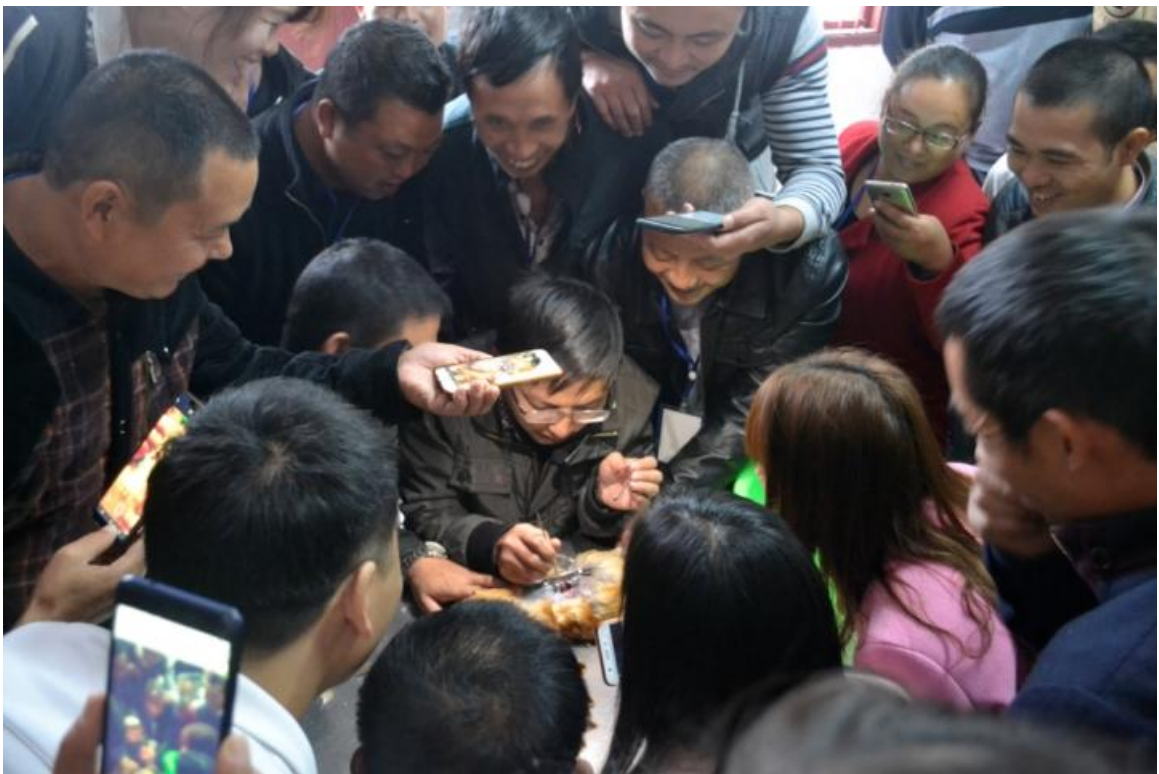
家禽解剖技术实训