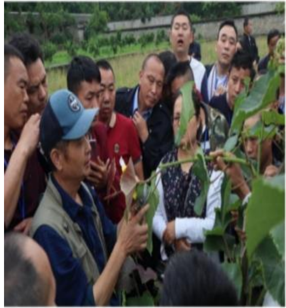
果树嫁接、修剪技术实训